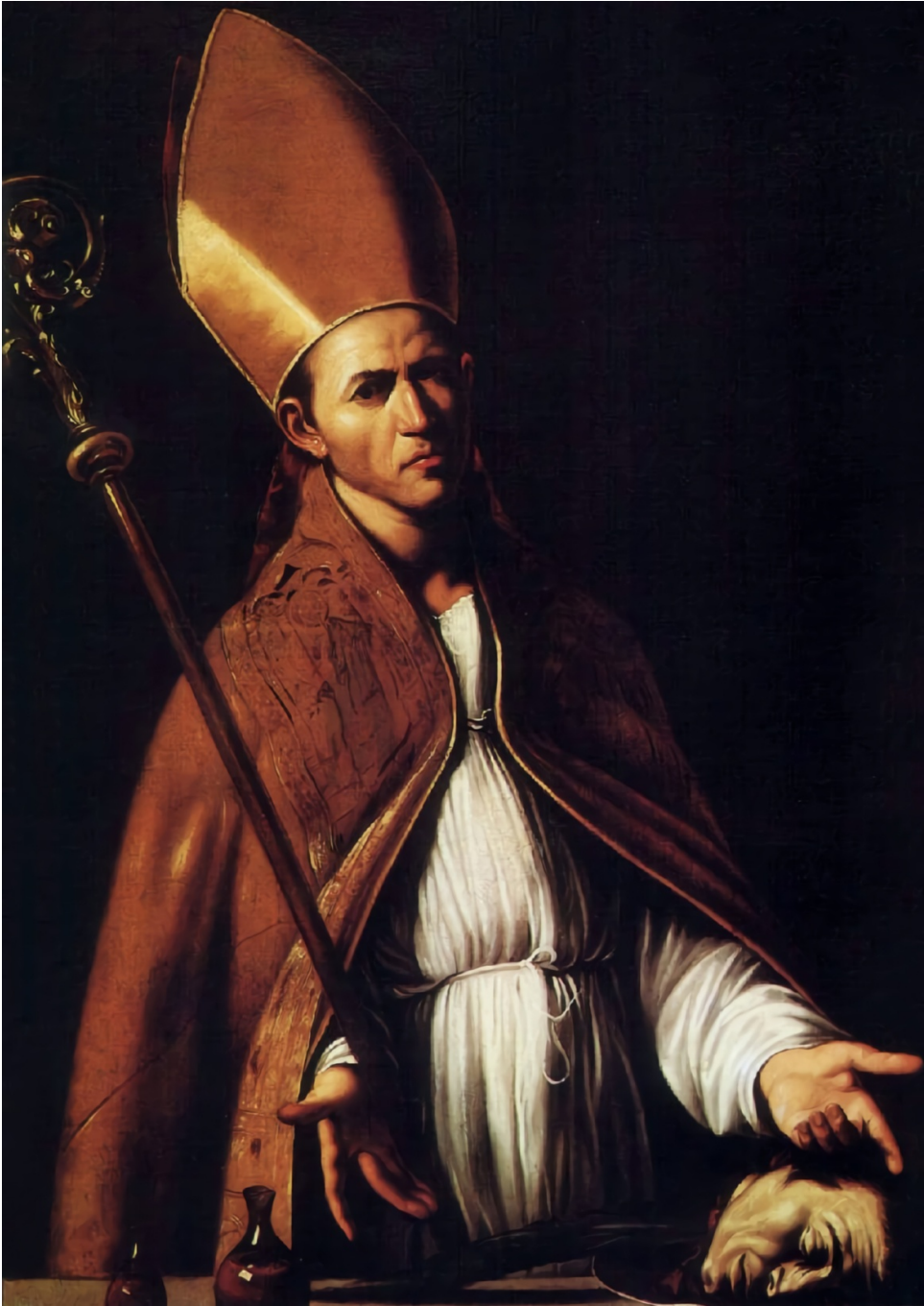
fig.20 -Louis Finson - San Gennaro mostra le sue reliquie (State College, Palmer Museum of Art)