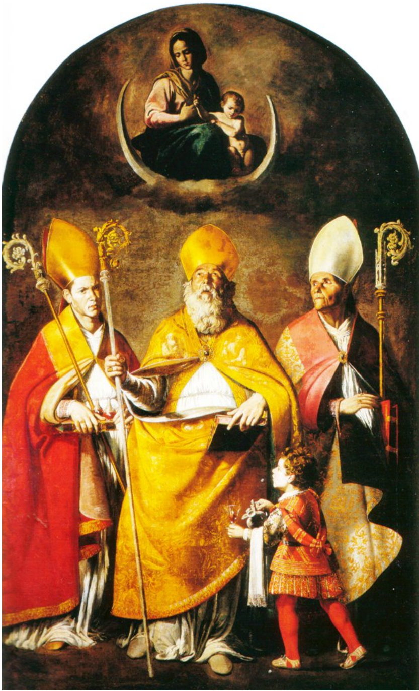
fig.7 -Filippo Vitale - La Vergine con i Santi Nicola, Gennaro e Severo (Napoli, Museo di Capodimonte)