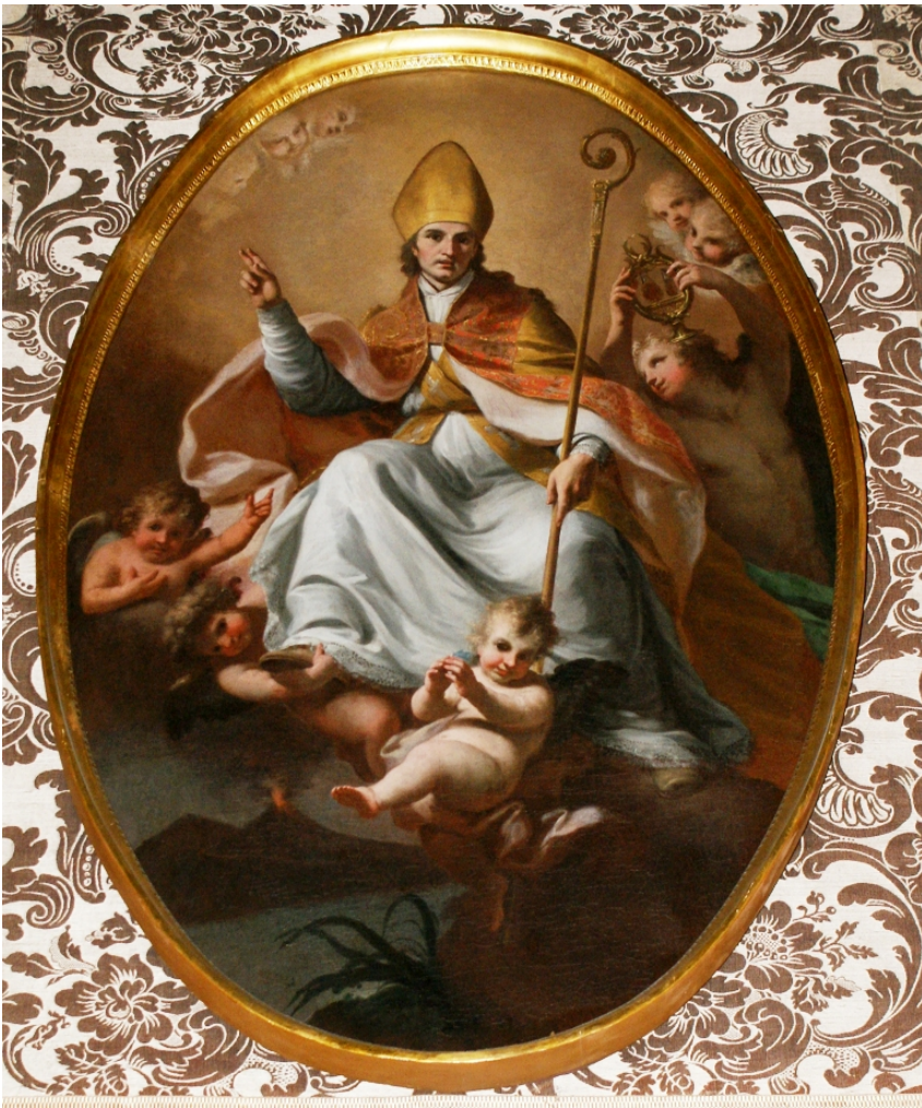
fig.6 -Fedele Fischetti - San Gennaro in gloria di Angeli (Napoli, Palazzo Reale)

Proponiamo ora ai lettori un vero capolavoro di Francesco Solimena che ci mostra la figura del Santo con le ampolle (fig.9), venerato nella Cappella del Tesoro di San Gennaro e poi di Giacinto Diano, nella chiesa di San Giovanni Battista a Gragnano, il celebre patrono in atto di compiere un miracolo (fig.10)