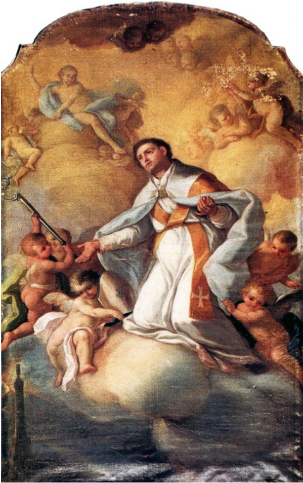
fig.10-Giacinto Diano - Miracolo di San Gennaro (Gragnano, San Giovanni Battista)

Proseguiamo la nostra carrellata mostrando un dipinto di Giovanni Balducci, conservato a Napoli nel museo diocesano, raffigurante San Gennaro con il cardinale Alfonso Gesualdo (fig.11), mentre in cielo due angioletti si divertono giocando. Segue poi un quadro di Giacomo del Po, conservato nel museo di Capodimonte, con San Gennaro con i simboli vescovili (fig.12), mentre un angioletto regge le ampolle; una immagine di alta qualità cromatica, che colloca l'autore in linea con gli esiti del barocco di Luca Giordano.