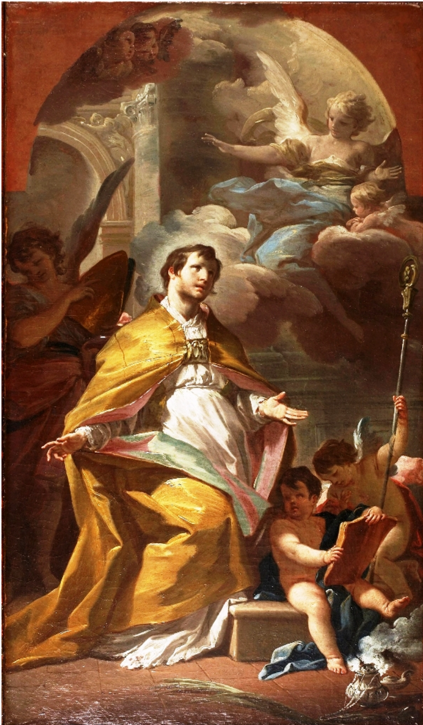
fig.5 -Corrado Giaquinto - San Gennaro (Princeton, University Art Museum)

Nel Palazzo Reale di Napoli è conservato di Fedele Fischetti un poco noto dipinto raffigurante: San Gennaro in gloria con gli angeli (fig.6), mentre nel museo di Capodimonte vi è un vero capolavoro di Filippo Vitale