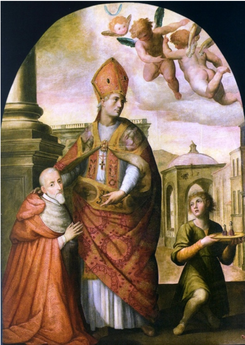
fig.11 -Giovanni Balducci- San Gennaro con il cardinale Alfonso Gesualdo (Napoli, Museo Diocesano)

Improvvisamente tra tanti giganti del pennello fa la sua comparsa un writer di nome Jorit, che ha affrescato con l'immagine di San Gennaro (fig.14) un'intera parete in piazza Crocette ai Mannesi, nel cuore di Forcella, il quartiere più malfamato della città.