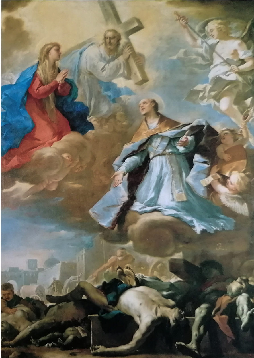
fig.19 -Luca Giordano- San Gennaro intercede per la fine della peste (Napoli, Museo di Capodimonte)