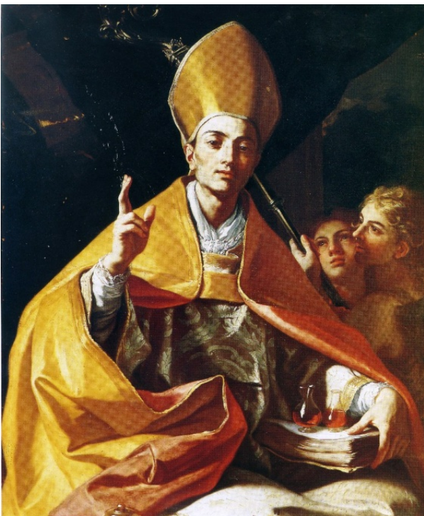
fig.9 -Francesco Solimena - San Gennaro (Napoli, Duomo)