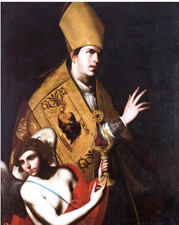
fig.16 -Pacecco De Rosa- San Gennaro con angelo reggiampolle (Collezione privata)