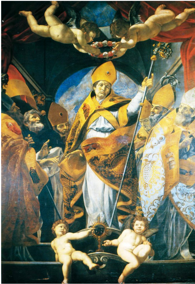
fig.1 -Battistello Caracciolo-Gloria di San Gennaro tra i santi patroni di Napoli (Napoli, Certosa di San Martino)

La figura di San Gennaro è stata ripresa ed esaltata dai maggiori pittori dal Cinquecento ai nostri giorni, a volte da solo, altre volte in compagnia dei suoi colleghi, come in questo dipinto di Battistello Caracciolo (fig.1) conservato nella Certosa di San Martino ed intitolato: Gloria di San Gennaro fra i santi patroni di Napoli , nel quale al centro troneggia il nostro eroe con ai piedi il reliquiario con le ampolle di sangue, mentre ai lati è ammirato da altri patroni di Napoli: Severo, Agnello, Atanasio, Aspreno, Eufebio ed Agrippino.