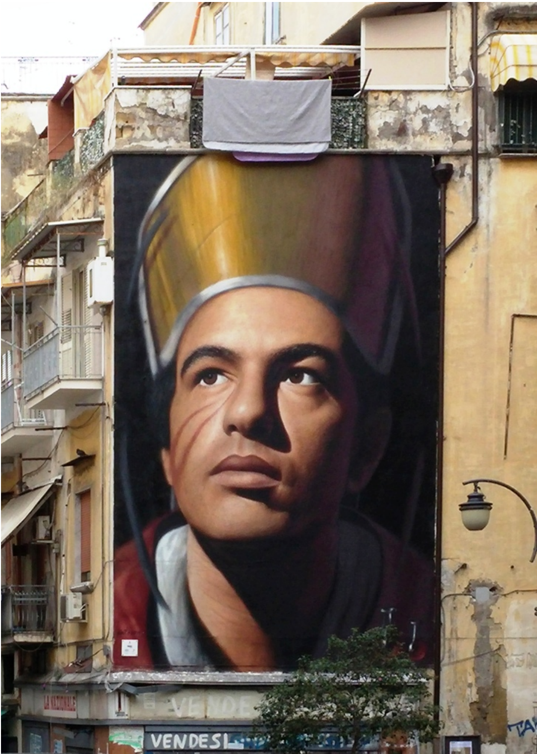
fig.14 -Jorit - San Gennaro (Napoli, Piazza Crocelle ai Mannesi)

Ritorniamo ad autori seri con il capolavoro di Onofrio Palumbo, che, in collaborazione con Didier Barra, a cui spetta la accurata descrizione della città, ha fissato sulla tela l'immagine di San Gennaro che cerca di