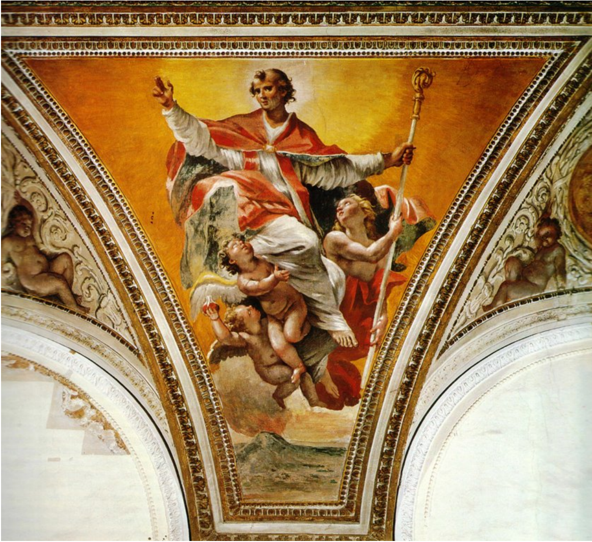
fig.13 -Giovanni Lanfranco- San Gennaro (Napoli, Oratorio dei Nobili)