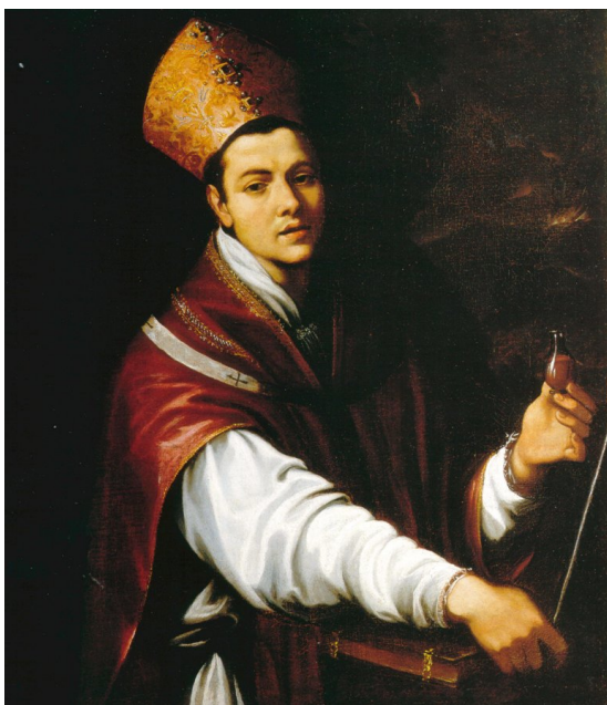
fig.4 -Fabrizio Santafede- San Gennaro (Castellammare di Stabia, Collezione privata)