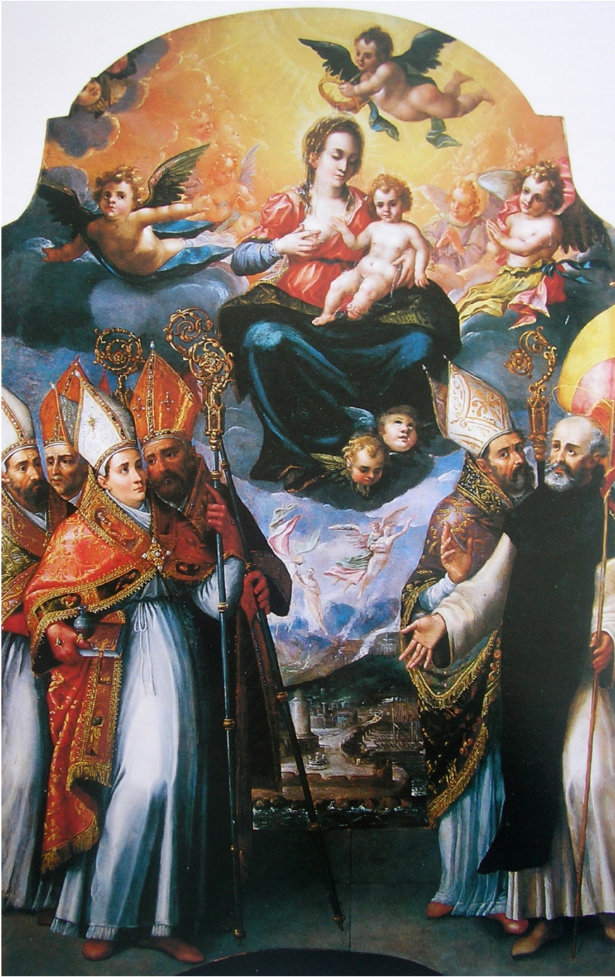
fig.18 -Pietro Torres - Madonna delle Grazie tra i Santi patroni di Napoli (Napoli, Museo Diocesano)