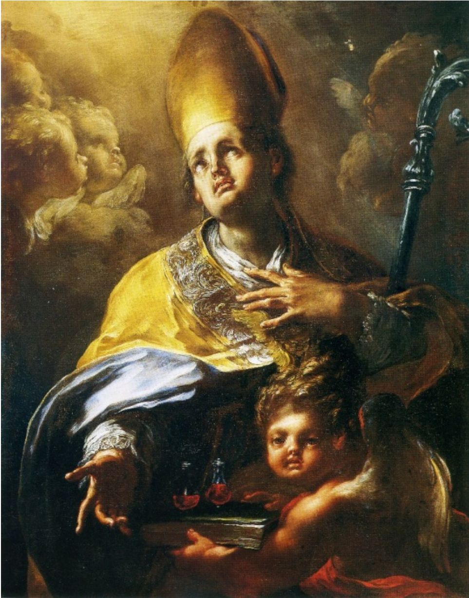
fig.12 -Giacomo Del Po- San Gennaro (Napoli, Museo di Capodimonte)