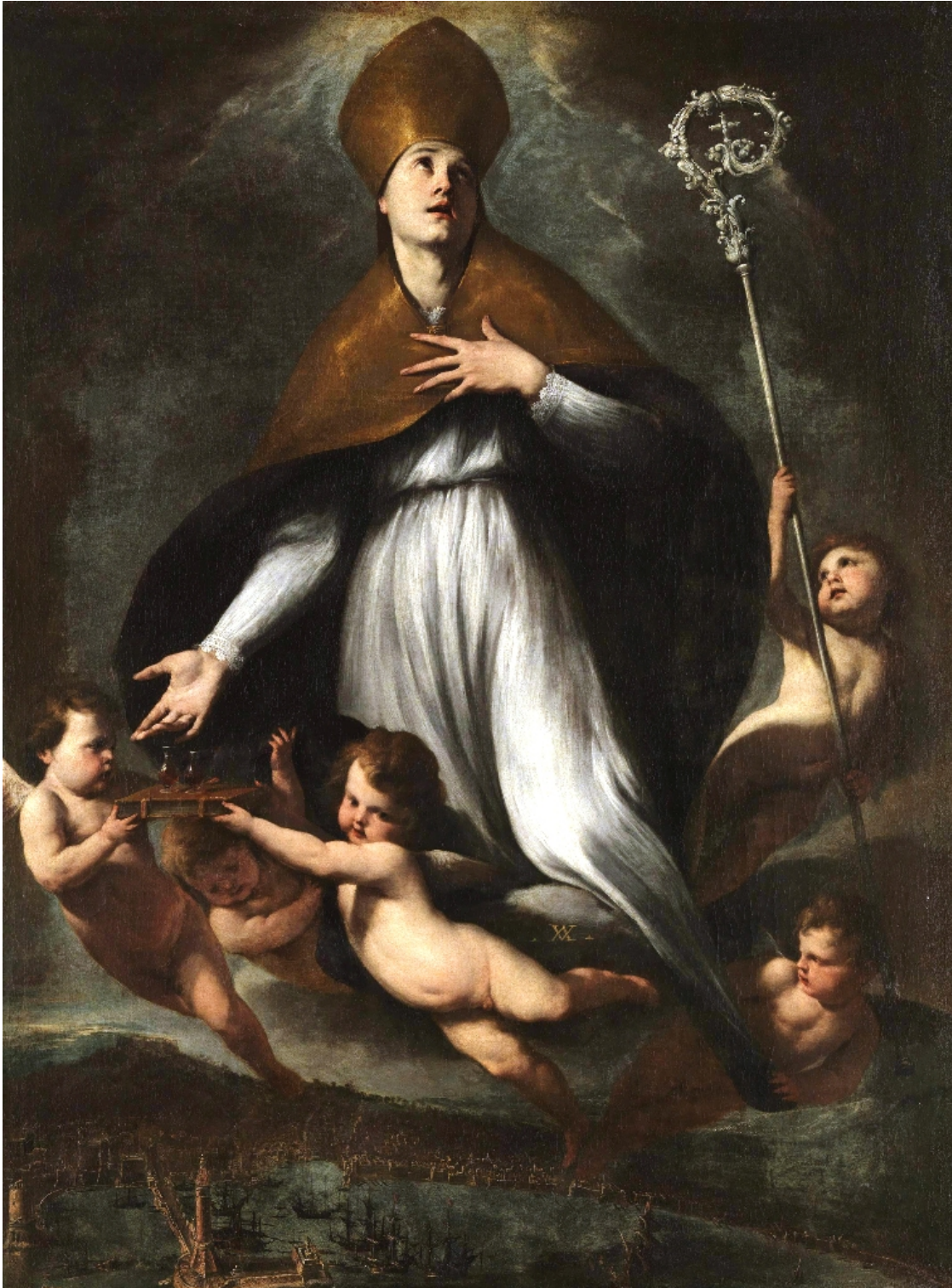
fig.2 -Andrea Vaccaro-Ascensione di San Gennaro (Madrid, Prado)

Passiamo poi ad Andrea Vaccaro, che ci raffigura l'Ascensione verso il cielo di San Gennaro (fig.2) in un quadro conservato nel museo del Prado di Madrid.