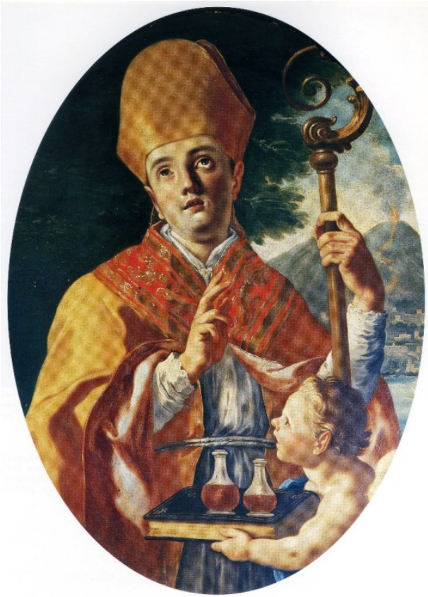
fig.8 -Francesco De Mura - San Gennaro (Napoli, Cappella del Monte di Pietà)