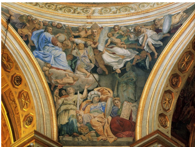
fig.3 -Domenichino - Esaltazione di San Gennaro (Napoli, Duomo)

Poscia in una collezione privata di Castellammare di Stabia è conservato un poco noto dipinto (fig.4) di Fabrizio Santafede, mentre un altro esaltante quadro di Corrado Giaquinto, raffigurante il Santo in preghiera (fig.5), si può contemplare a Princeton nella University Art Museum.